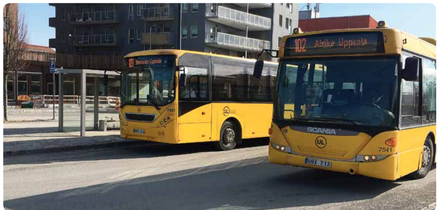
Lösningen. Det måste bli attraktivare att välja bussen.